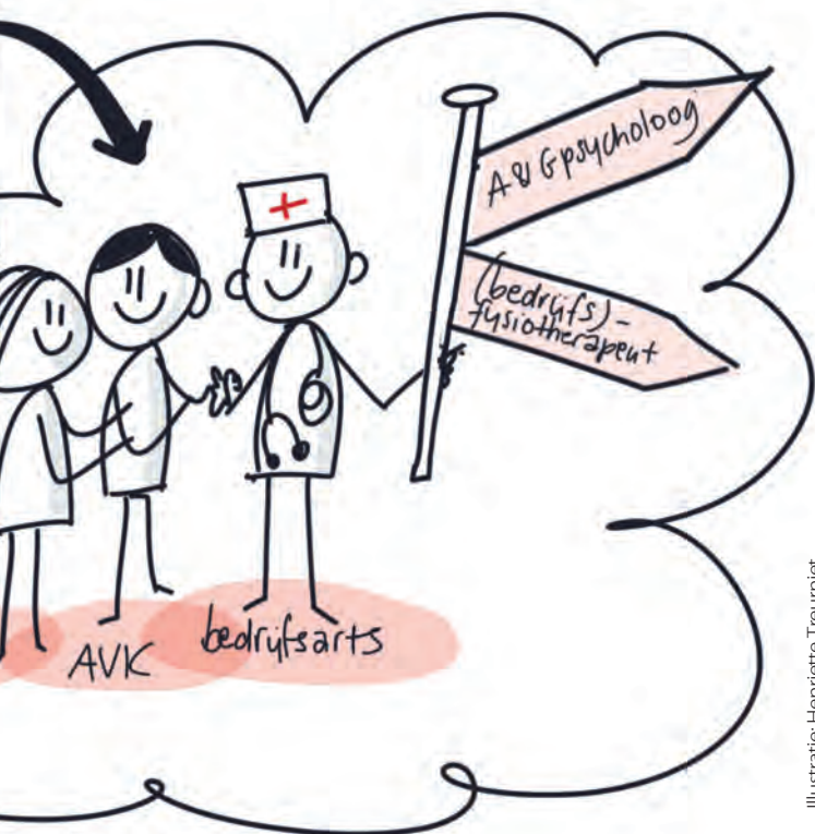
Illustratie: Henriëtte Treurniet

satiepsycholoog. “De GZ-psychologen zijn vooral uit op een reductie van klachten, terwijl je herstel van functioneren op werk wilt bereiken”, constateert Noordik. “Daarnaast wil je een link leggen met de leidinggevende, het team en de organisatie van het werk. Een A&O psycholoog begeleidt weer geen verzuimen- de werknemers, omdat die vooral gefocust is op preventie.”